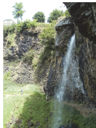
Chemin de la cascade

3 Faire un détour dans le bourg pour découvrir sa petite église puis remonter jusqu'au stationnement point de départ de la randonnée.