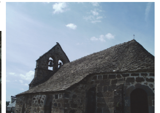
Eglise Saint Pantaléon de Salins (12e, 16e, 18e et 19e siècle)