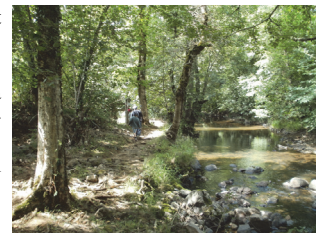
Le calme des berges de l'Auze