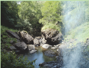
Derrière la cascade

Arrivé dans le petit bourg de Salins, vous pourrez remarquer son église dédiée à Saint Pantaléon et dépendant autrefois de l'Abbaye de la Chaise-Dieu. A noter sur le portail de l'église une représentation sculpturale de la lune et du soleil.