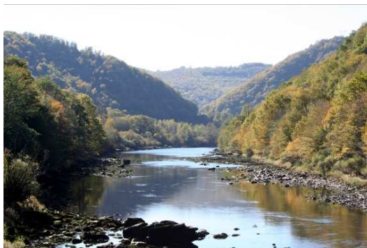
La confluence de l'Auze et de la Dordogne

Dans une petite clairière, poursuivre à gauche par un chemin dans la chênaie. Dans le bas de la pente, laisser un chemin à gauche, et rejoindre la Maison de la Forêt de Miers.