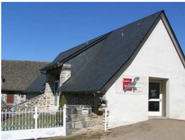
La Maison des Rapaces, à Chalvignac

Continuer pour rejoindre le hameau de Crouzit-Bas.