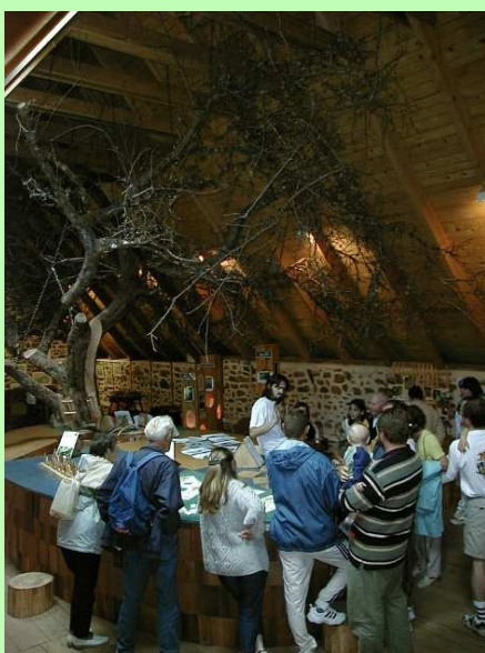
La Maison de la Forêt de Miers

2 Avant d'entrer dans Doumis, prendre le chemin qui part à gauche dans les prés. La pente s'accroît à l'entrée dans la forêt.