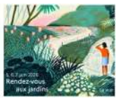
Château de la Trémolière Anglards-de-Salers Samedi 6 et dimanche 7 juin 2026 10h30-12h30 / 14h-19h