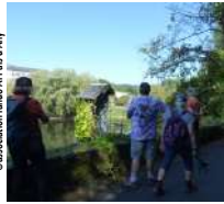
© Association rando Al Pays d'Ally