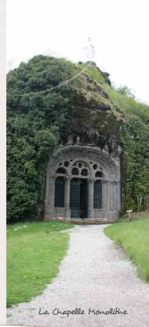
La Chapelle Monolithe

La chapelle monolithe mesure 15 m de long, 11 m de large et 8 m de haut. La porte en fer forgé de l'entrée est encadrée d'une archivolte romane sculptée par Jean Ribes et de colonnettes. Celle-ci porte également le blason des familles de Fontanges, Lamargé et La Farge. A l'intérieur, l'autel en pierre de Volvic porte quant à lui les armes des Fontanges, Pesteils et Beauclair, anciens seigneurs des lieux. La chapelle a été inaugurée le 29 septembre 1901, en l'honneur de la Vierge et de Saint Michel.