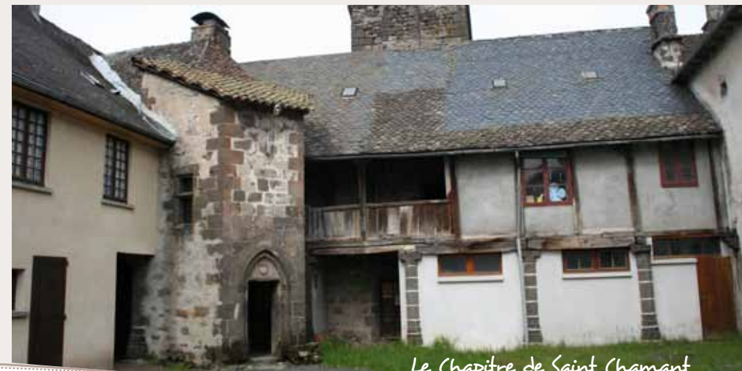
Le Chapitre de Saint Chamant