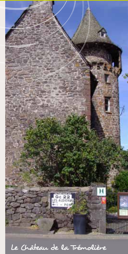
Le Château de la Trémolière