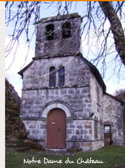
Notre Dame du Château

Sur l'autel reposait la statue en bois d'une Vierge noire romane, dont le culte commença dès la fin du 11 ème siècle et qui fait encore aujourd'hui l'objet d'un pèlerinage le 12 août.